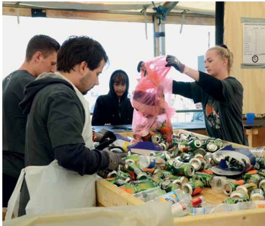
Hver drikkebeholder skal sorteres efter type, når panten gøres op på de store træborde.

► verdensstjerner som rockbandet Foo Fighters og rapperen NAS, virker det ikke til, at det er festivalens cirka 175 koncerter, der har tiltrukket de frivillige. Det er derimod i høj grad det fællesskab, de unge oplever i pantboden.