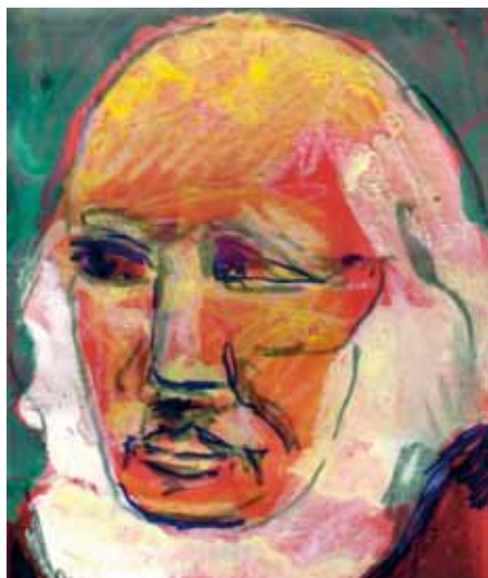
Af Ole Vind