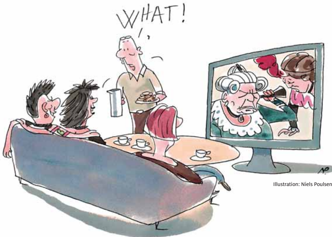
Illustration: Niels Poulsen