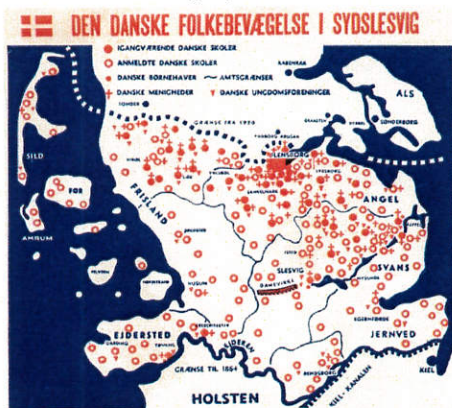
Fra en af udvalgets første udgivelser.

På hjemmesiden og i bladet har du mulighed for at holde dig orienteret om historien og nyheder.