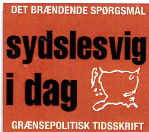
Fra bladets forside.

Sydslesvigsk Udvalg af 5. maj 1945 ”Sydslesvig i dag” Louisevej 2A DK-6100 Haderslev